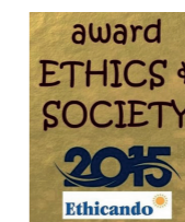
Premio Etica e Società 2015 allo chef Massimo Spigaroli